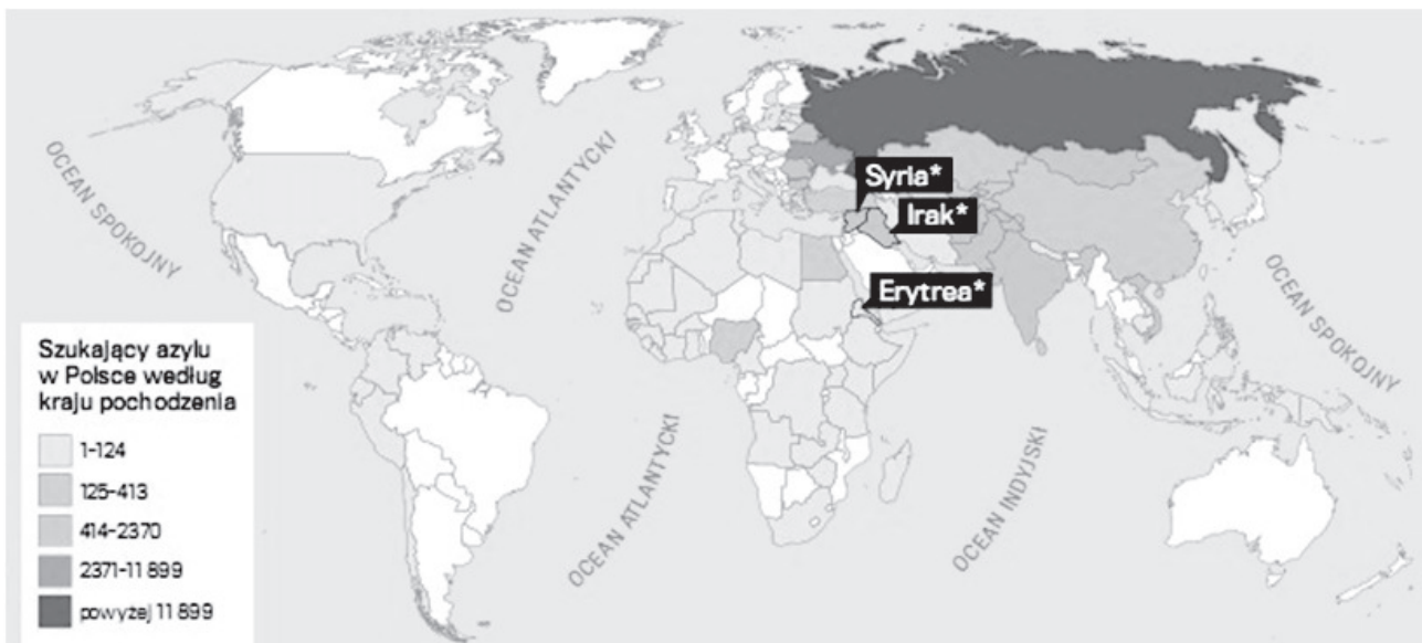
Rys. 2. Osoby szukające azylu w Polsce w latach 1999–2015.

Zgodnie z ustawą o udzielaniu cudzoziemcom ochrony na terytorium Rzeczypospolitej Polskiej postępowanie o udzielenie azylu cudzoziemcowi wszczynane jest na jego wniosek, gdy jest to niezbędne do zapewnienia mu ochrony oraz gdy przemawia za tym ważny interes Rzeczypospolitej Polskiej. Pozbawianie azylu następuje w razie ustania przyczyny, dla których został udzielony, lub gdy azylant prowadzi działalność skierowaną przeciwko obronności lub bezpieczeństwu państwa albo bezpieczeństwu i porządkowi publicznemu. Decyzje w sprawach udzielania i pozbawiania azylu wydaje Szef Urzędu ds. Cudzoziemców za zgodą ministra spraw zagranicznych.