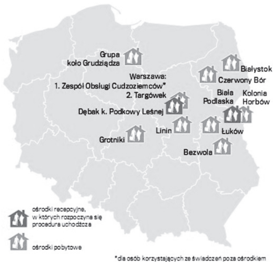
Rys. 3. Ośrodki dla cudzoziemców w Polsce.