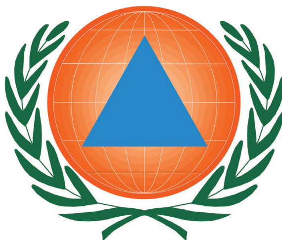
Ryc. 1. Emblemat Międzynarodowej Organizacji Obrony Cywilnej.

W roku 1958 Strefy Genewskie stały się organizacją pozarządową i przyjęły nazwę Międzynarodowa Organizacja Obrony Cywilnej (dalej: ICDO), która nawiązała współpracę z narodowymi organizacjami obrony cywilnej, przedsięwzięła i promowała studia w zakresie ochrony ludności; planowała wymianę doświadczeń i koordynację działań w dziedzinie zapobiegania katastrofom, przygotowania i interwencji. W tym samym roku utworzono w Genewie Międzynarodowe Centrum Alarmowania przed Zagrożeniami Radioaktywnymi (International Centre of Radioactive Alert) (ICDO, 2017). Podkreślić należy, że w latach 1958–2001 odbyło się 12 światowych konferencji zorganizowanych przez ICDO. Stworzono możliwość przynależności indywidualnej i zbiorowej do organizacji, pełne uczestnictwo w pracach organizacji jest zagwarantowane tylko dla państw członkowskich, które zaakceptują konstytucję. Pierwszymi krajami, które przystąpiły do ICDO były Egipt, Iran i Filipiny. Siedemnastego października 1966 r. członkowie organizacji uchwalili tekst konstytucji. Sześć lata później, w 1972 r., w życie weszła Konstytucja ICDO, która we wstępie określa jej status jako organizacji międzyrządowej. Postanowiono także obchodzić co roku, 1 marca, Światowy Dzień Obrony Cywilnej. Dopiero w 1976 r. Szwajcarska Rada Federalna (ang. Swiss Federal Council) i ICDO podpisały umowę o uregulowaniu statusu prawnego organizacji w Szwajcarii (ICDO, 2017).